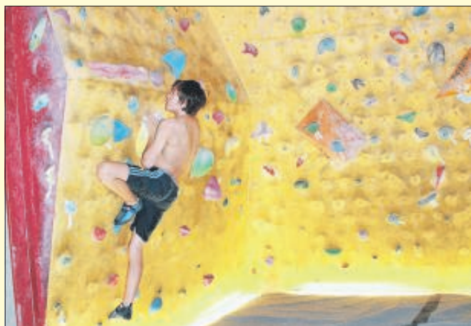
Ein erweitertes Angebot gibt es im Squash und Fit in Waldstetten. Dazu gehört unter anderem der Familien-Sporttag zum günstigen Preis.

Squash und Fit bietet nun Familien-Sporttag und Kletter-Zusatzangebot