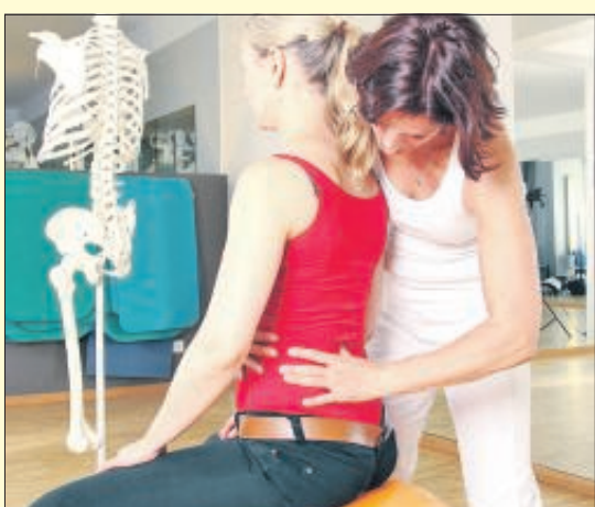
Es werden auf über 150 Quadratmetern physiotherapeutische Leistungen geboten.

In der modernst eingerichteten Praxis werden auf über 150 Quadratmetern alle physiotherapeutischen Leistungen geboten: Krankengymnastik, Massagen, Lymphdrainage, in Kürze manuelle Therapie, Wärmebehandlung, Schlingentisch, Krankengymnastik an Geräten und Rehasport.