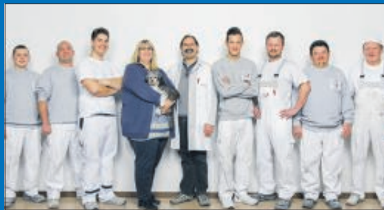
Das Team der Malerwerkstätte Hörner colorativ in Herlikofen.