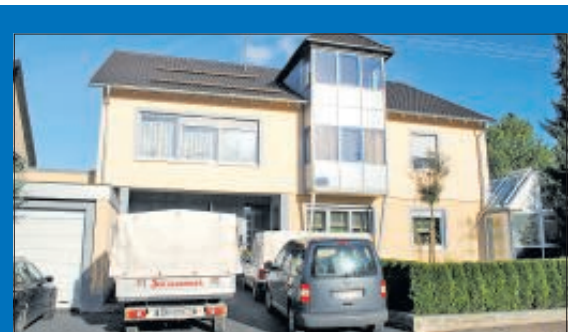
Der Malerfachbetrieb Sachsenmaier im Gmünder Stadtteil Hussenhofen.

Malerfachbetriebe sparen nicht bei der Qualität des Materials und setzen Profi-Farbe ein, bei der ein fachmännisch ausgeführter Arbeitsgang für ein perfektes Aussehen der Wand genügt.