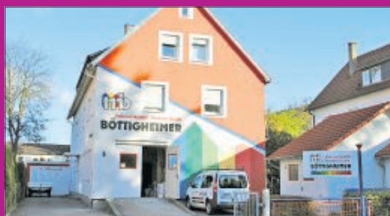
Malerwerkstätte – Heimtextstudio Böttigheimer im Buchhölzlesweg in Gmünd.

Vom Wetter her lässt der Frühling bereits lange auf sich warten, um so mehr ist es jetzt die richtige Zeit, neue Frische in Wohnräume, Bäder und Treppenhäuser zu bringen. Das Wohnumfeld wird vom Grauschleier des vergangenen Winters befreit und mit neuen Farben freundlich und hell gestaltet.