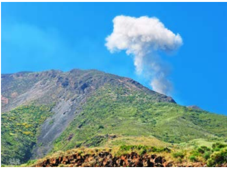
Blick auf den Stromboli (Zusatzausflug)

schönsten Italiens zählt. Danach besuchen Sie Altomonte, eine typisch kalabresischen Kleinstadt mit zahlreichen steilen Treppen und verwundenen Gassen. Über der Stadt thront die gotische Kirche Santa Maria della Consolazione. Mit vielen Eindrücken kehren Sie am Abend zurück zum Hotel. Abendessen im Hotel.