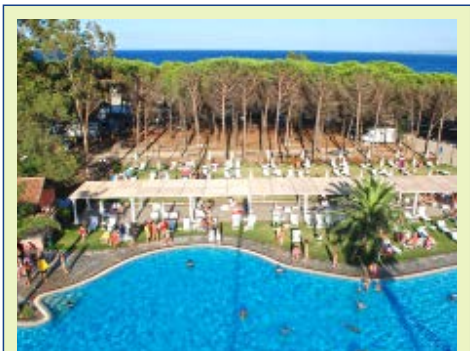
In herrlicher Lage: Salice Club Resort

Nach dem Frühstück Abfahrt nach Serra San Bruno. In Serra San Bruno, eine niedliche Ortschaft zwischen Wäldern gelegen, besuchen Sie das Museum der Certosa di San Bruno und die Kirchen. Am Nachmittag Ankuft in Pizzo Calabro, einem der schönsten und berühmtesten Fischerdörfer mit einem historischen Stadtkern, charakteristisch durch die engen Gassen und Plätzchen. Hier besuchen Sie die kleine Kirche von Piedigrotta, die in einen Fels gebaut ist und im Strand am Meer liegt. Dann machen Sie eine Pause, um das berühmte Tartufo-Eis zu probieren (fakultativ), das in der ganzen Welt bekannt ist. Rückkehr zum Hotel. Abendessen und Übernachtung im Michelizia Tropea Resort.