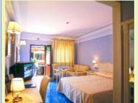
Zimmerbeispiel Salice Club Resort