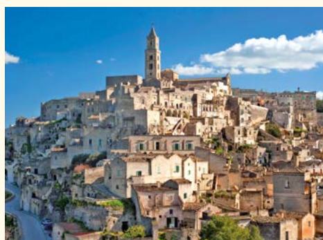
Felsenstadt Matera (Zusatzausflug)