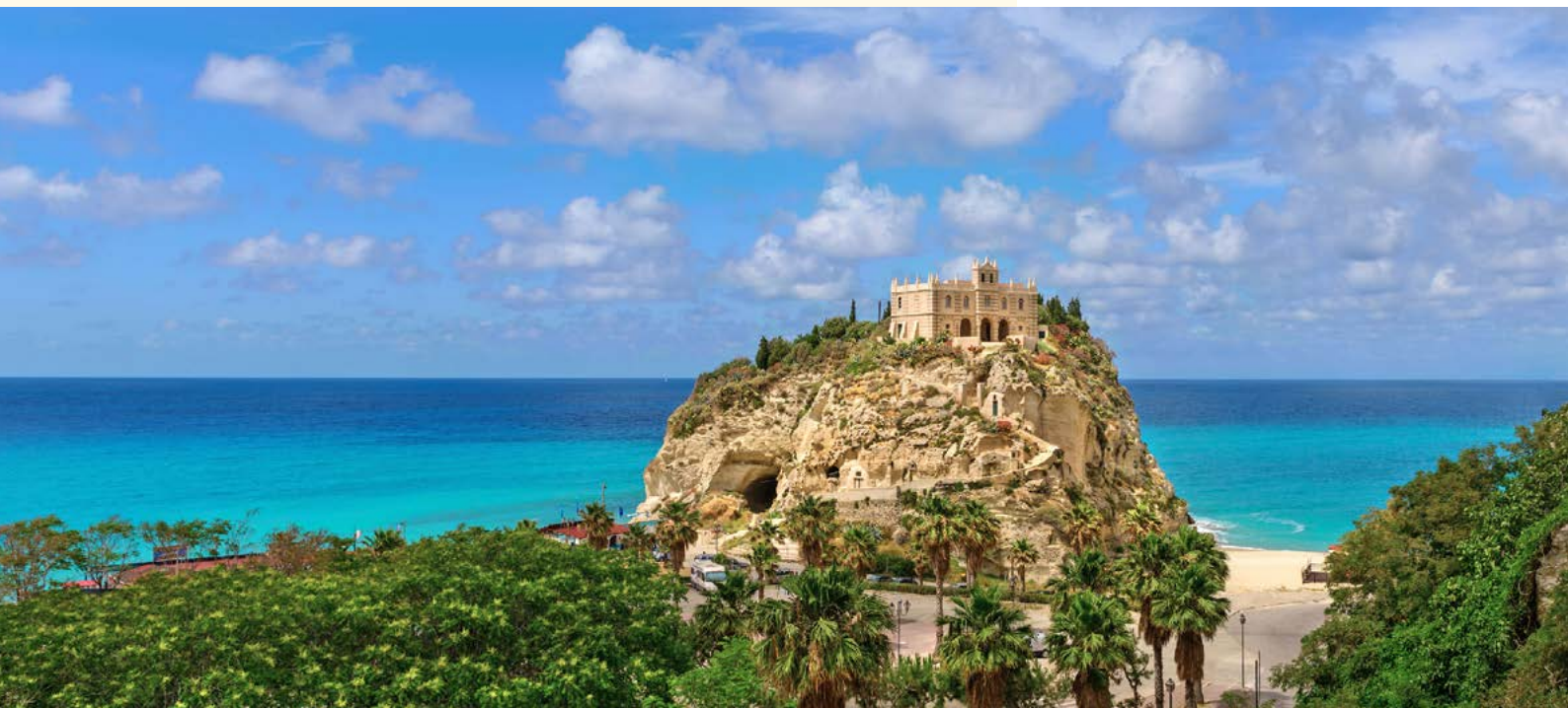
Die byzantinische Kirche Santa Maria dell'Isola in Tropea

Reiseverlauf: Sibari - Civita - Morano Calabro - Altomonte - Diamante - Paola - Tropea - Capo Vaticano - Serra San Bruno und Pizzo