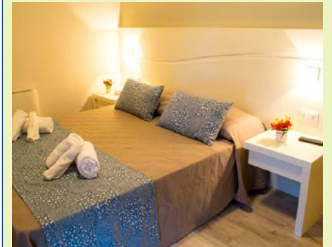
Zimmerbeispiel Michelizia Resort