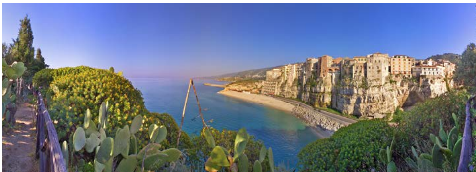
Blick auf Tropea