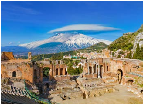
Das Freilichttheater in Taormina