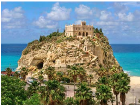
Santa Maria dell'Isola in Tropea