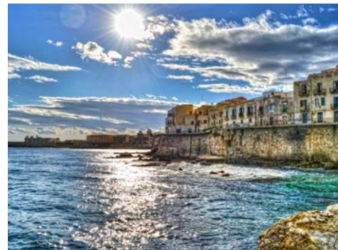
Syrakus: Altstadtinsel Ortygia

06.04. - 13.04.2020 • Flug ab/an Stuttgart • ab € 1.395,- p.P. im Doppelzimmer