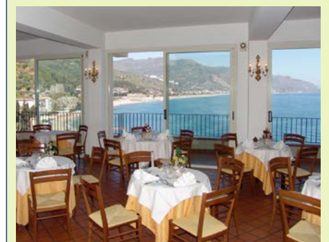
Restaurant des Bay Palace Hotels

Heute entdecken Sie Lipari und Vulcano, zwei der „sieben Schönheiten des Tyrrhenischen Meeres“, wie die Liparischen Inseln liebevoll genannt werden. Früh am Morgen fahren Sie zur wunderschönen Hauptinsel Lipari - bereits Odysseus wusste, dass hier das Herz des Archipels schlägt: im Schatten des Burgfelsens ist der Pulsschlag sizilianischer Lebenslust am deutlichsten zu spüren. „Vier Augen müsste man haben - quattro occhi!“ - dieser Stoßseufzer verlieh dem überwältigenden Aussichtspunkt in 200 m Höhe seinen ungewöhnlichen Namen: in kühner Eleganz erheben sich hier Äoliens Faraglioni aus dem Meer und stehen ihren weltberühmten Schwestern im Golf von Neapel um nichts nach. Bei einer Rundfahrt erleben Sie die Schönheiten der Insel und haben danach Freizeit zur Erkundung des Städtchens Lipari mit seiner malerischen Altstadt und der antiken Akropolis mit seinem archäologischen Museum. Ein weiterer Höhepunkt dieses Tages ist die Überfahrt zur Nachbarinsel Vulcano, schon Aristoteles wusste vom explosiven Temperament dieses dampfenden Eilandes zu berichten. Heute brodeln die Quellen unter-