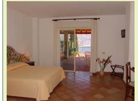
Zimmerbeispiel Bay Palace Hotel

labriens. Auf dem Weg nach Scilla entfalten sich die Landschaftswelten der Costa Viola, die mit ihren verträumten Dörfern, der unberührten kalabrischen Natur und den felsigen Küstenlandschaften eine Panoramaaussicht auf das Tyrrhenische Meer und die Straße von Messina erlauben. Bei Scilla angekommen, gilt der erste Besuch Chianalea, dem in Scilla integrierten alten Fischerdorf, der Klippe von Scilla mit dem historischen Castello Ruffo di Scilla und der traditionsreichen Kirche Chiesa dell'Immacolata. Der Ausflug führt außerdem in die Stadt Reggio Calabria. Die Gründung der Stadt lässt sich in das Jahr 720 vor Christus zurückdatieren. Vor Ort bekommen Sie einen Einblick in das Archäologische Museum der Stadt, das Fundstücke aus prähistorischer, antiker und mittelalterlicher Zeit vorzeigen kann. Höhepunkt der Sammlung sind die zwei weltbekanntesten Bronzestatuen von Riace, die aus dem 5. Jahrhundert vor Christus stammen. Auf einem entspannten Spaziergang entlang des Uferwegs Gabriele D'Annunzio können Sie die als schönsten Kilometer Italiens getaufte Promenade entdecken. Am späten Nachmittag geht es mit der Fähre nach Sizilien.