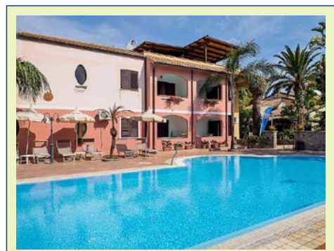
Hotel Costa degli Dei