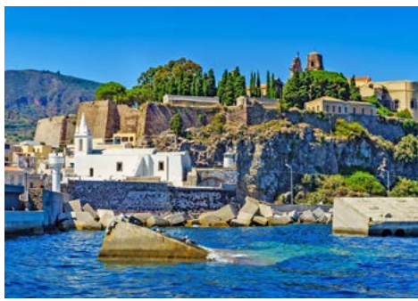
Im Hafen von Lipari (Zusatzausflug)