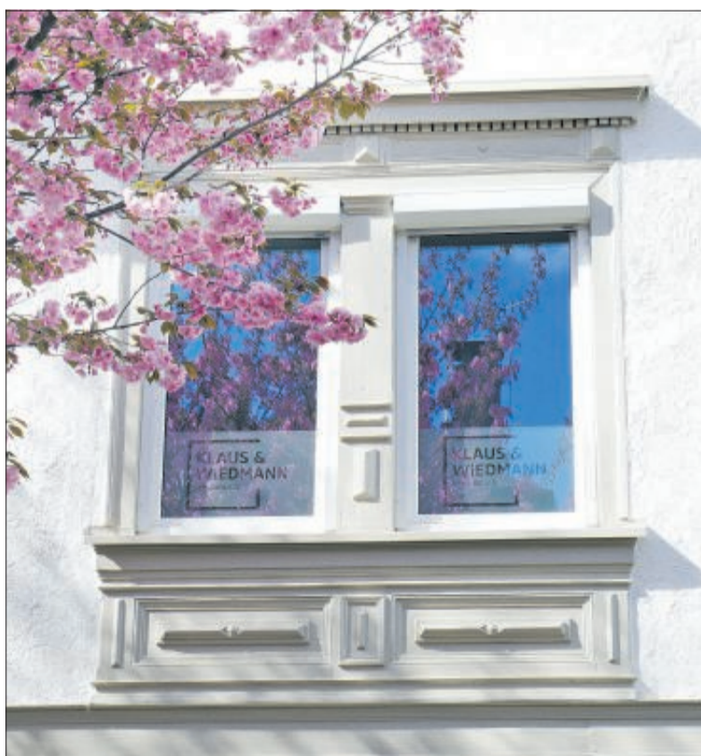
In der Gartenstraße 6, 1. Obergeschoss, finden sich die Büroräume des Immobilien-Dienstleisters.