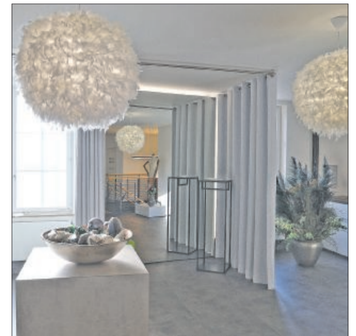
Ecken zum „Chillen“ gehören zum Konzept des neuen Geschäfts.