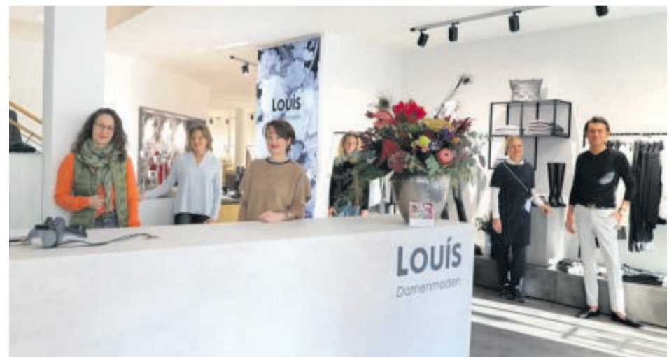
Das Team (auf dem Bild fehlen Frau Balb und Frau Reichenauer)