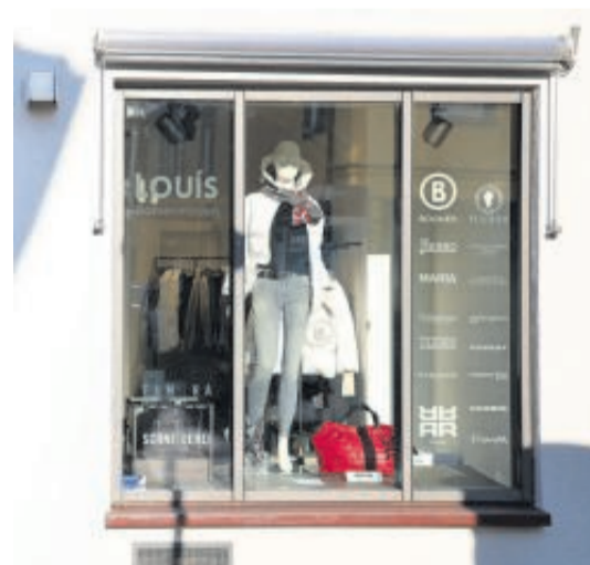
Schaufenster in der Postgasse