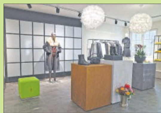
In Sachen Kleidung und Schuhe gibt es bei Louis Damenmoden Produkte führender Marken.