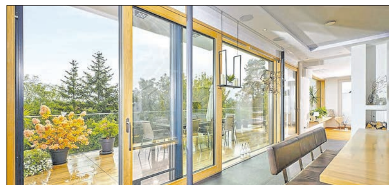
Mehr als 90 Prozent der in Deutschland hergestellten Fenster werden heute individuell nach Kundenwunsch gefertigt.