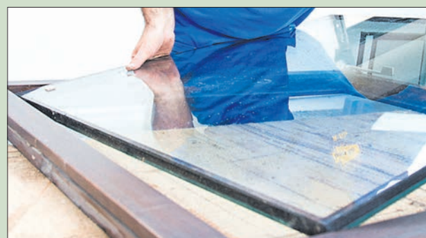
Fensterabdichtung und Isolierglasaustausch gehören zu den Spezialitäten der Firma bau-ko auf dem Gmünder Lindenfeld.