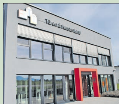
Wie man Einbruch und Diebstahl einen Riegel vorschiebt, weiß man im Türen & Fenster Land in Herlikofen genau.