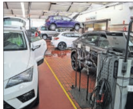
Freundlicher und kompetenter Service für die Marken Volkswagen, Cupra und Seat sowie alle anderen gibt es bei der Autowelt Marton+.