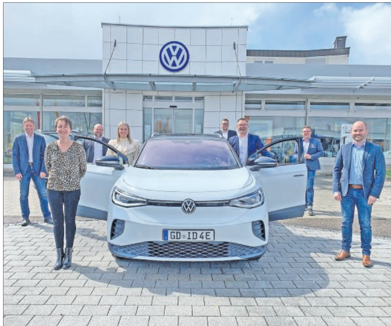
Zur Markteinführung des neuen VW ID.4 veranstaltet das Autohaus B. Widmann mit seinem Verkaufsteam am 22. und 23. April Testtage für Kunden und Interessenten.

Den neuen ID.4 gibt es in drei Leistungsvarianten, mit 109 kW (149 PS), 125 kW (170 PS) und 150 kW (204 PS). Dazu gibt es neun unterschiedliche Ausstattungsvarianten. Die Reichweite beträgt bis zu 520 km. Eine weitere Besonderheit ist das neue, auf Wunsch er-