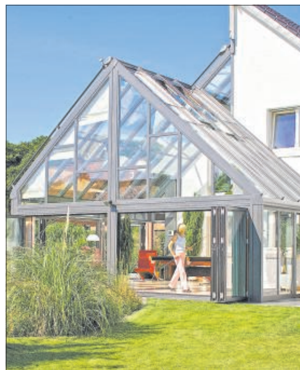
Ein Wintergarten verlängert die Gartensaison.

Aber auch die Montage eines Sonnenschutzes im Außenbereich kann sinnvoll sein, da das Aufheizen der Glasscheiben von vornherein verhindert wird. Für große Fensterfronten können Lamellenvorhänge praktisch sein. Sie werden mit einem Seil auf- oder zugezogen und eignen sich gut für Allergiker, da sich kein Staub ansammelt. Wer sich gern auf der Terrasse aufhält, denkt vielleicht über einen Wetterschutz nach. Eine wetterfeste Überdachung schützt nicht nur vor schlechtem