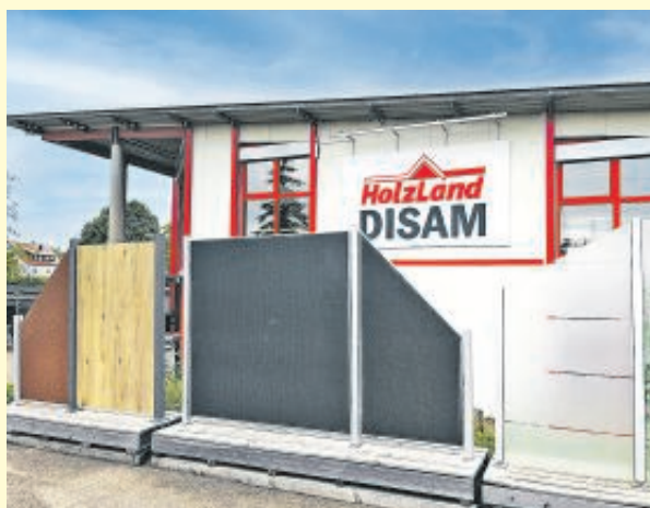
In der Ausstellung bei Holzland Disam gibt es eine große Auswahl an Sichtschutzvarianten.

für eine durchsichtige Variante wie Kunststoff oder Glas entscheidet, muss vielleicht einen zusätzlichen Sonnenschutz anbringen. Bei der Wahl des Materials sollte man die Optik auf die des Bodenbelags anpassen. Außerdem ist es schön, wenn sich die Überdachung in das Gesamtbild des Hauses integriert und mit anderen Elementen harmoniert. Bei der Montage muss eine ausreichende Höhe eingeplant werden, um Dekorations- oder Beleuchtungselemente nachträglich problemlos anbringen zu können. (lps/DGD)