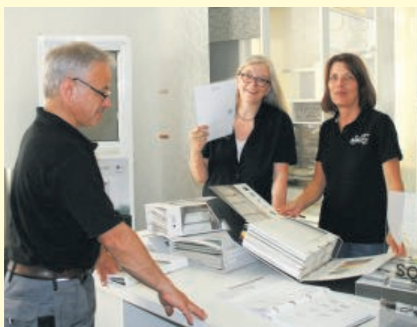
Das Team von Schwenk Raumausstattung hat viele Ideen zum Thema Sicht- und Sonnenschutz.