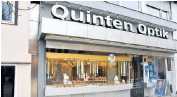
Schon fast eine Institution in Gmünd ist Optik Quinten in der Ledergasse.