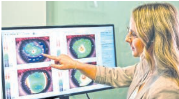
Erstklassige Beratung und modernste Technik rund ums Sehen finden Sie bei K-Optik in Mutlangen.

räumen aufgehalten haben und viel seltener draußen gespielt haben. Studien zufolge kann ein täglicher Aufenthalt von nur zwei Stunden im Tageslicht das Risiko für eine Myopie bereits halbieren. Es gibt mittlerweile einige Therapiemöglichkeiten, darunter das Tragen spezieller Kontaktlinsen in der Nacht. Ips/DGD