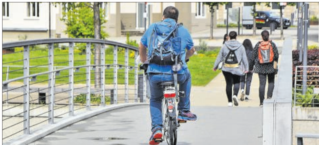
Die Stadt Schwäbisch Gmünd investiert viel dafür, um das Fahrradfahren attraktiver und sicherer zu machen.

Das ist geplant: So will die Stadt die Verkehrssituation für das Fahrrad verbessern