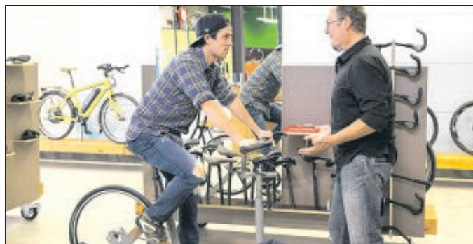
Mit der richtigen Einstellung funktioniert es auch mit dem ermüdungsfreien Radeln.

Beim Radfahren bilden Fahrer und Fahrrad eine Einheit. Damit die Kraft optimal übertragen wird, gibt es die Möglichkeit, das Fahrrad individuell anpassen und einstellen zu lassen. „Bikefitting“ heißt das Schlagwort. Gemeint ist das Anpassen des Rades und aller seiner Komponenten an die individuellen Körpermaße. Hier können wenige Millimeter enorme Veränderungen bewirken. Das kann von der Einstellung der Sattelhöhe bis hin zur Positionierung der Cleats an den Schuhen gehen. Auch Vermessungen des Körpers gehören dazu, um basierend auf der Datenanalyse die individuell richtigen Einstellungen vorzunehmen. Jeder Radfahrer sollte sich über Bikefitting Gedanken machen, egal ob er tausende von Kilometern fährt, eine lange Tour plant oder regelmäßig zur Arbeit pendelt. Die