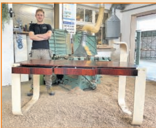
Der zur Lampe werdende Tischfuß ist nicht die einzige Besonderheit des Schreibtisches aus der Möbelwerkstatt.

Der mit Rio-Palisander furnierte Korpus des Schreibtisches aus der Möbelwerkstatt Lösch wird umfasst von formverleimten Tischfüßen. Der rechte Fuß ragt an der hinteren Ecke im Bogen über die Tischplatte und hat eine Lampe sowie einen Wärmesensorschalter integriert. In die Längsseite des Schreibtisches sind drei Schubkästen aus Wenge mit Nutleisten-Führung eingebaut. Ist der mittlere Schubkasten herausgenommen, bekommt man Zugang zu einem Geheimfach.