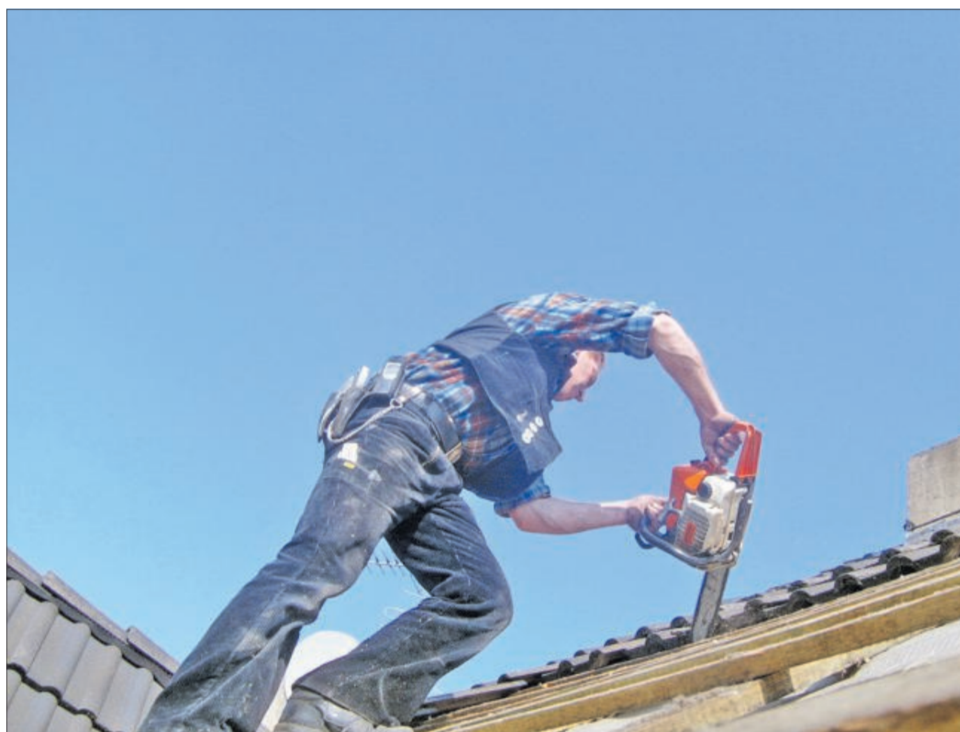
Dacharbeiten sollten immer von Profis durchgeführt werden.

Professionelle Dachdecker erkunden vor Baubeginn das Vorhandensein von Wärmebrücken. Dabei handelt es sich um Stellen, an denen mehr Wärme von innen nach außen strömt, als es in ihrer Umgebung der Fall ist. Um diese Orte zu finden, lohnt sich das Hinzuziehen von Profis aus dem Handwerk.