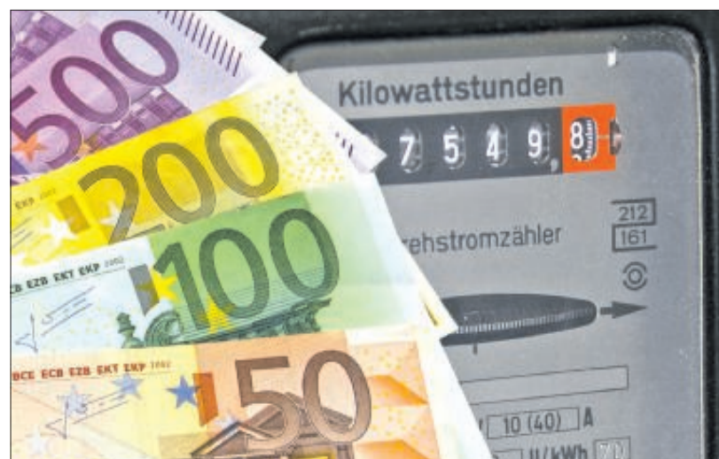
Altgeräte haben oft einen höheren Strombedarf.

Während im Winter oft das ganze Haus oder die Wohnung warm bleiben soll, können in der Übergangszeit wenig genutzte Räume unbeheizt bleiben. Regelmäßige Wartung und gegebenenfalls Erneuerung der Heizanlage durch professionelle Monteure beugt einem Energieverlust vor und ist eine Möglichkeit, langfristige Kosten zu sparen.